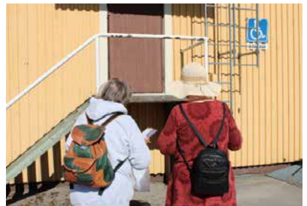
Kävelyllä tarkasteltiin mm. rakennuksiin kulkua ja havainnot kirjattiin tarkistuslistaan.

Kävelylle osallistuneet pitivät esteettömyyskävelyä tärkeänä tapahtumana ja sille toivottiin jatkoa. Seuraavana vuorossa voisi olla talvella järjestettävä kävely. Lisäksi todettiin, että esteettömyys ja saavutettavuus ovat kokonaisuus, johon kuuluvat sekä fyysinen ympäristö että digitaaliset palvelut. Nyt järjestetystä kävelystä koostetaan raportti, joka julkaistaan syksyllä.