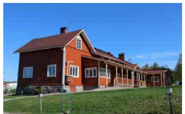
Kuntalan rakennus, jossa toimii myös Hyvinvointitupa, oli yksi tarkasteltavista rakennuksista