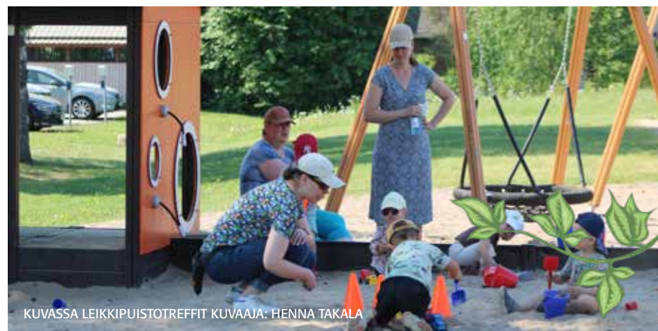
KUVASSA LEIKKIPUISTOTREFFIT