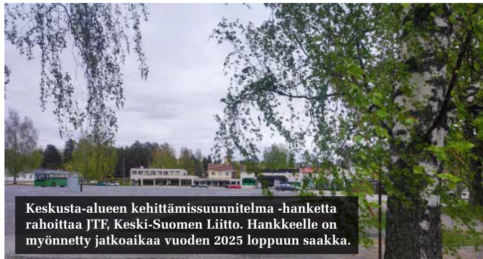
Keskusta-alueen kehittämissuunnitelma -hanketta rahoittaa JTF, Keski-Suomen Liitto. Hankkeelle on myönnetty jatkoaikaa vuoden 2025 loppuun saakka.