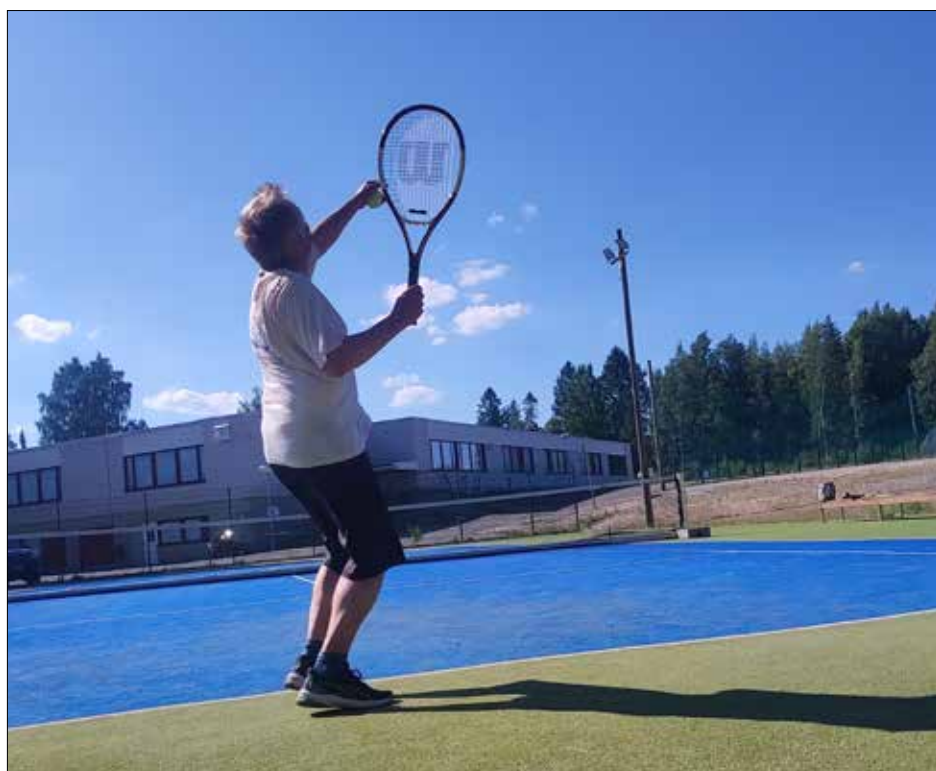
Tennisärsät voivat varata pelivuoton vaikka kännykällä

Ensi syksynä järjestelmän kautta voi varata ja maksaa myös Puulan seutuopiston kursseja.