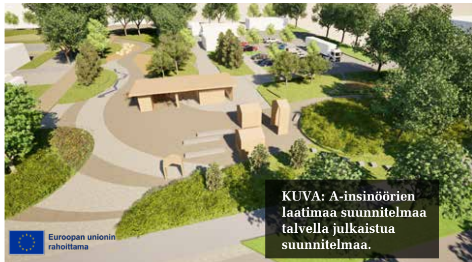
KUVA: A-insinöörien laatimaa suunnitelmaa talvella julkaistua suunnitelmaa.