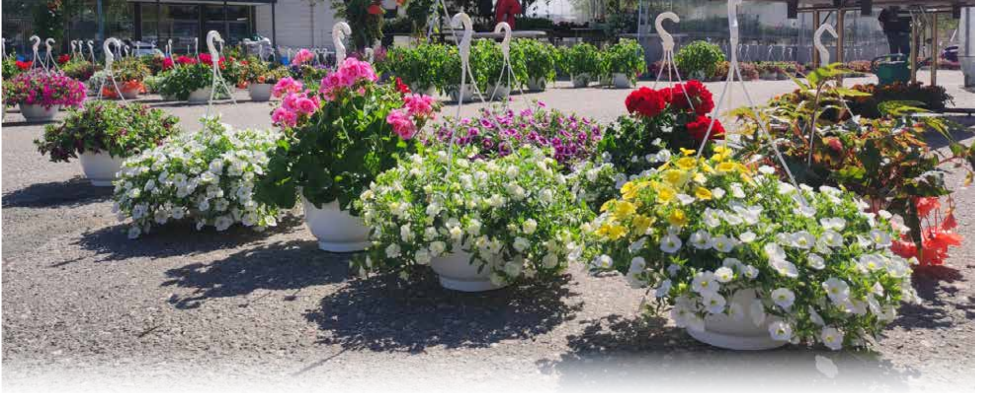
KUVA: Torikauppiaiden kukkien loistoa Joutsan nykyisellä torilla. Tulevaisuudessa torilla kukoistaa myös uusi keskuspuisto.